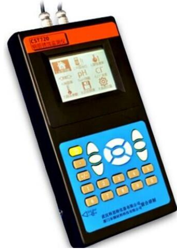
图 1. CST720 巡检式混凝土钢筋锈蚀监测仪

用户可以通过菜单实现单参数或多参数的自动测量, 测量结果自动保存在非易失性存储器内。用户也可通过配套的管理软件将测量数据下载到 PC 机, 实现数据分析和绘图处理。