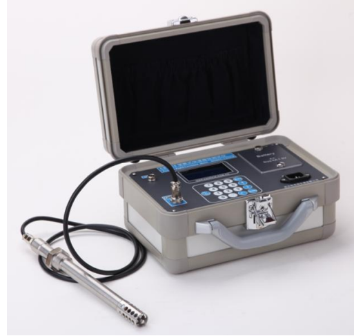
图 1. CST810E 多通道腐蚀测试仪

CST810E 腐蚀测试仪集成了交流阻抗 (EIS) 测量原理的优点, 具有易于携带、操作简便、测量迅速、显示结果直观等特点。仪器全部采用交流阻抗测量模式, 可以准确地测量工作电极与参比电极间的介质电阻 R_s , 并自动从极化电阻 R_p 中减掉介质电阻 R_s , 从而获得准确的腐蚀速率, 这一点尤其适用于介质电阻较大的腐蚀环境, 如含油污水、土壤或混凝土体系。仪器采用定时自动测量, 内置实时日历时钟, 能自动定时唤醒测量, 可用于现场的连续监测。供电采用交直流自动切换, 内置充电电池(可选), 用于现场无电源情况下使用, 满电状态下可以连续测量 60 小时。