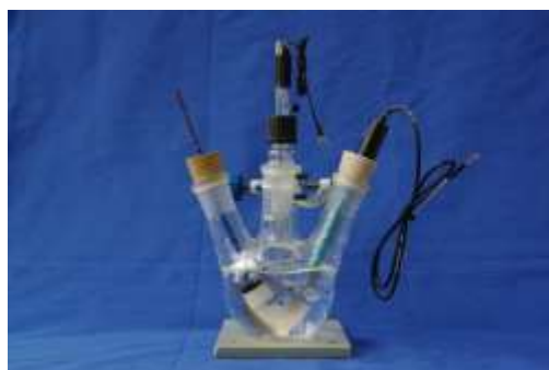
图 3 两种电解池与电极的连接示意图