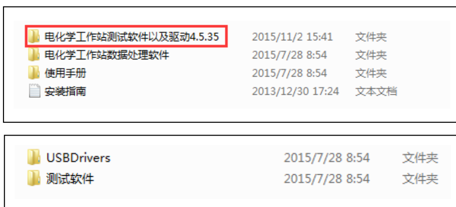
图1. 安装光盘或U盘中内容

2) 打开电化学工作站电源，插入安装光盘或U盘，内容如下图1，点击“ 电化学工作站测试软件及驱动 ”，根据电脑的系统选择相应的文件包如win7，win8，XP，先点击安装“ USB Drivers ”驱动程序，驱动程序安装成功后，再安装相应的“ 测试软件 ”。