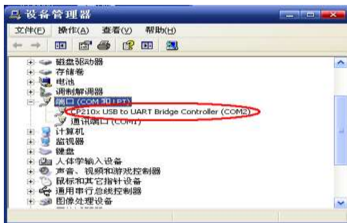
图 2. USB 正确安装后设备管理器端口

3) 正确安装驱动程序后，在设备管理器中“端口(COM和LPT)”下应出现 CP210x USB to UART Bridge Controller (COM x) ， x=1-6 ，“COM x”即为CP210x虚拟的COM端口号，如图2：