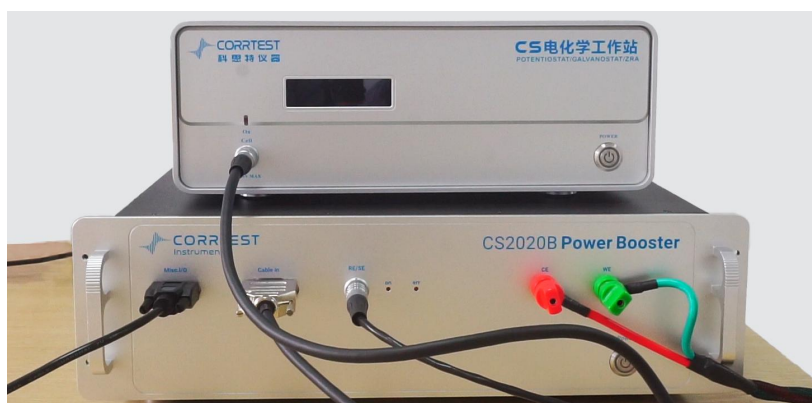
图 1. CS2020B 前面板电极线连接图

1) 将单通道电化学工作站（上）前面板的 6 芯航插用 DB15 母对母金属壳连接线与 CS2020B 功率放大器前面板的“Cable in”连接，CS2020B 专用电极电缆线（RE/SE 电极电缆线与 WE/CE 鳄鱼夹电极电缆线（或铜接线端子电极电缆线））插上，并拧紧，如下图 1。