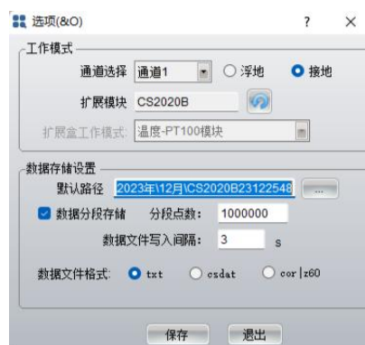
图 5. 软件中扩展模块刷新界面

6) 打开软件 CS Studio 6 软件，一般会自动搜索并连接，软件左上角显示 CS350M+CS2020B in com x，表示两台仪器均连接正常，如果没有显示 CS2020B，则在“系统设置”菜单中“选项”中扩展模块点击刷新后保存，即可正常连接。