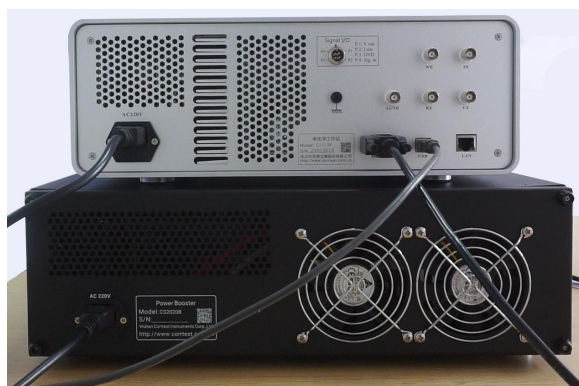
图 2. CS2020B 后面板连接图

2) 连接好工作站和 CS2020B 的电源线，工作站的 USB 数据线，再用 DB9 连接线将工作站后面板的“Misc.I/O”与 CS2020B 前面板的“Misc.I/O”相连，如图 2。