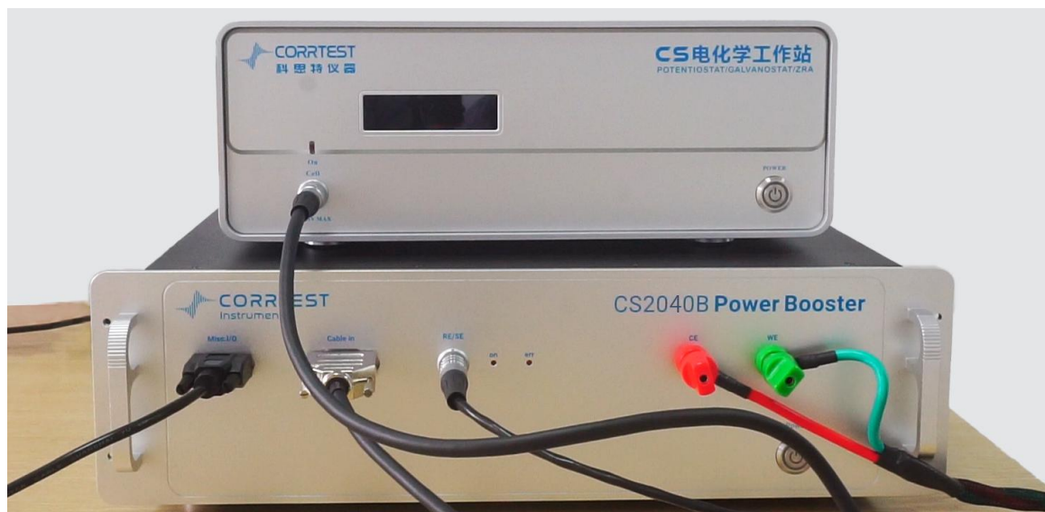
图 1. CS2040B 前面板电极线连接图

1) 将单通道电化学工作站（上）前面板的 6 芯航插用 DB15 母对母金属壳连接线与 CS2040B 功率放大器前面板的“Cable in”连接，CS2040B 专用电极电缆线（RE/SE 电极电缆线与 WE/CE 鳄鱼夹电极电缆线（或铜接线端子电极电缆线））插上，并拧紧，如下图 1。