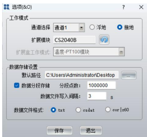
图 5. 软件中扩展模块刷新界面

6) 打开软件 CS Studio 6 软件，一般会自动搜索并连接，软件左上角显示 CS350M+CS2040B in com x，表示两台仪器均连接正常，如果没有显示 CS2040B，则在“系统设置”菜单中“选项”中扩展模块点击刷新后保存，即可正常连接。