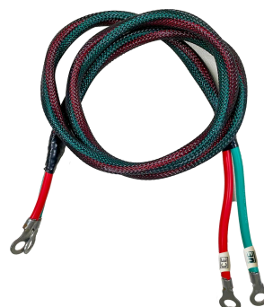
WE/SE 铜接线端子电极电缆线

图 3. CS2040B 专用电极电缆线(下面两种电极电缆线根据您的测试需求二选一即可)