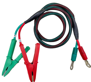
WE/SE 鳄鱼夹电极电缆线